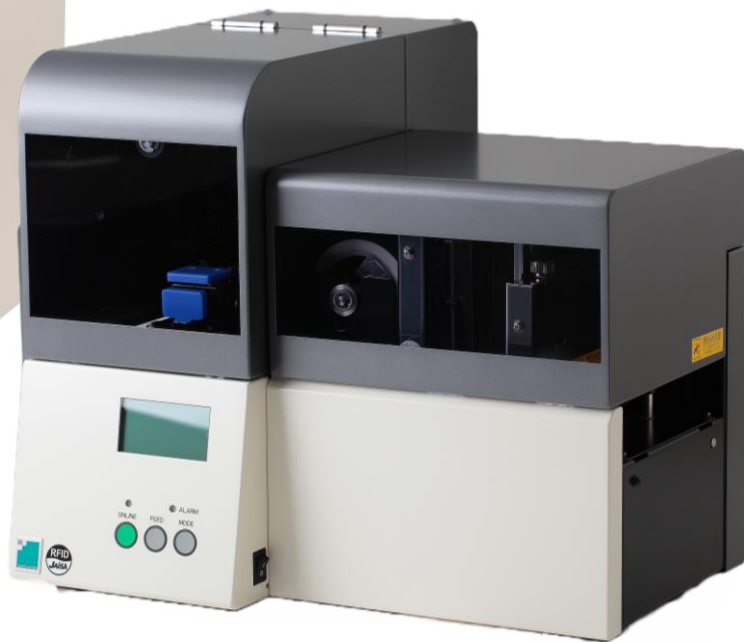
CardPro II TypeC